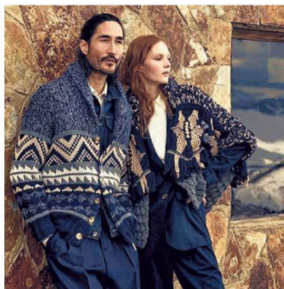
▲ I capi La collezione autunno-inverno 2023 di Brunello Cucinelli

“ Dobbiamo ridare dignità al lavoro artigianale di qualità: abbiamo fondato una scuola nella quale gli studenti vengono retribuiti ”