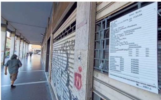
▲ L'intervento Sono iniziate le opere di manutenzione straordinaria dell'area

Via Capruzzi, i portici nel degrado E Lidl sbarca nell'ex sede Regione