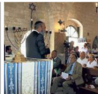
▲ A Trani La sinagoga

RAGGIX studio radiologico Responsabile: Dott. C. TRICARICO