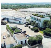
▲ La sede Lo stabilimento Master a Conversano

Ma l'impresa pugliese non sta solo agendo in termini di espansione. Sta anche continuando a investire in innovazione e ricerca a cui è dedicato un intero settore. Per questo, e per far fronte alle attuali esigenze di mercato, ha presentato il suo ultimo prodotto ad alto tasso tecnologico. Si tratta di un sistema di automazione delle finestre, chiamato «APRO» - Windows Automation System, che consente di gestire da remoto l'apertura di finestre e porte di un edificio, in modo del tutto automatizzato.